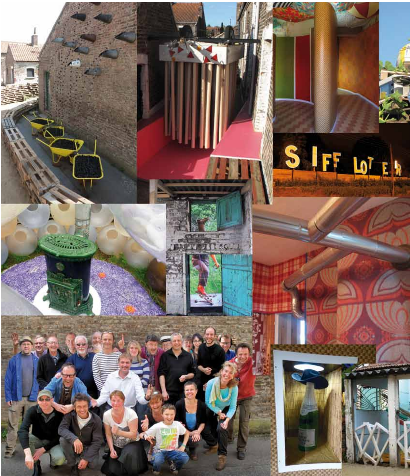
Le joyeux boyau de bienvenue, La promenade en palettes, Les fouilles d'archéologie ordinaire, Le palais des cheminées idéales, La piste de danse pour Martiens, Les trois p'tits coronas, La minuterie d'escalier, Le salon nautique, L'auditorium de façade, La maison au courant,