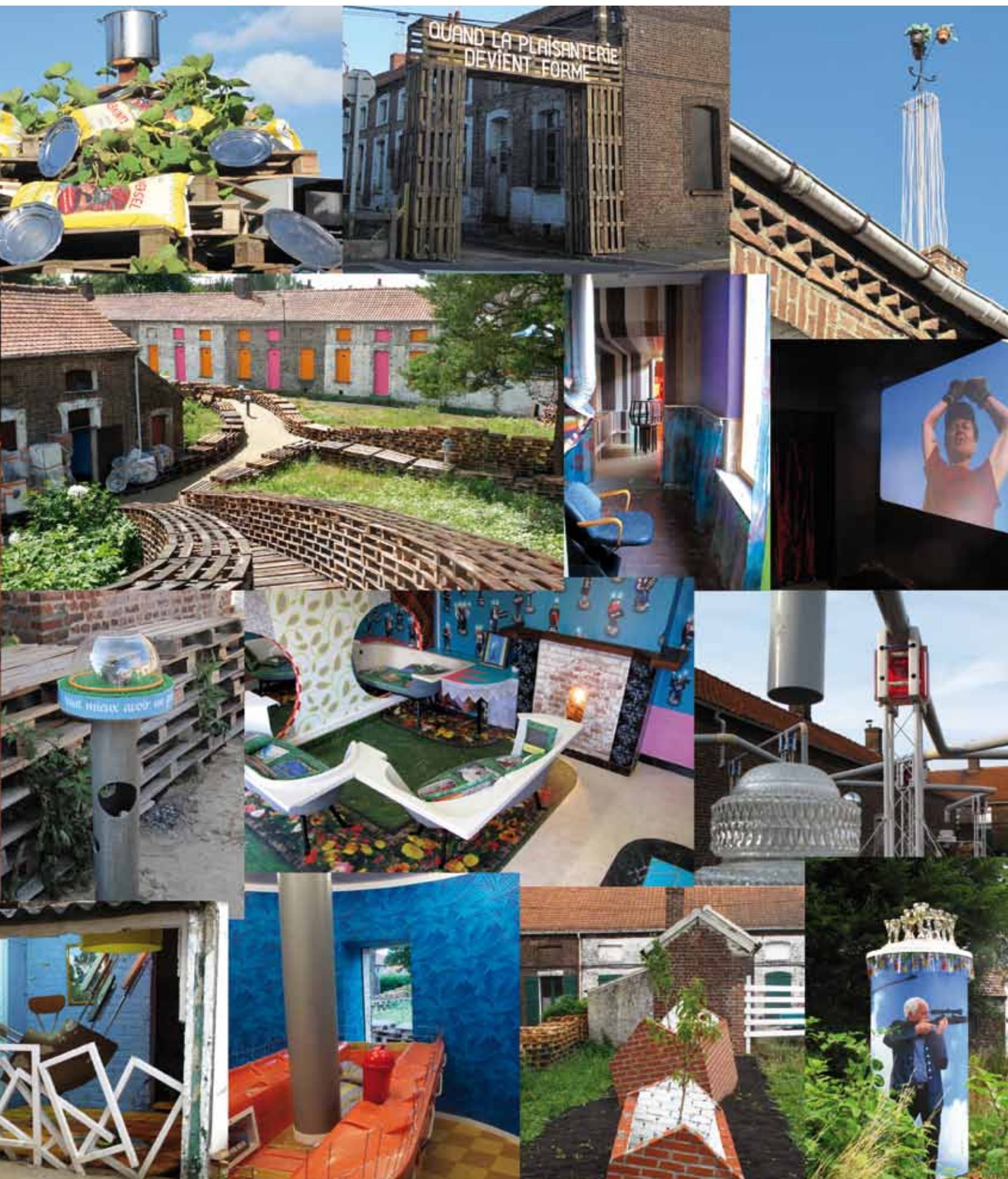
Les feux de l'igloo, La salle des tuyaux, Le cinéma de passage, Un restaurant panoramique, Le ventilophone, Le terril potager, La vérandada, Le saut du lipizzan, La fontaine aux boulets, La carabine et les papillons, Les cheminées surprises, Les clapiers composés, Siffloter.