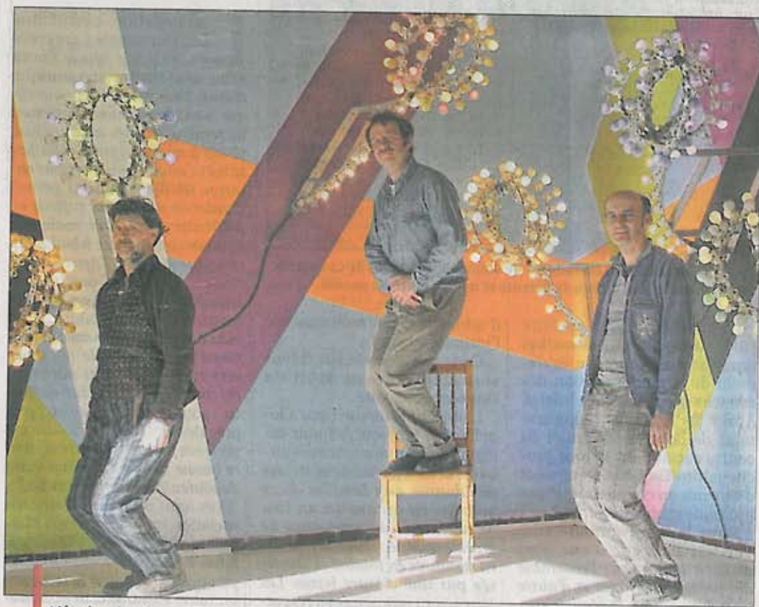
L'équipe des Pas perdus dans son salon incandescent, creuset de sessions d'élaborations poétiques qui veulent réinventer joyeusement le quotidien de la cité Fonscolombes.