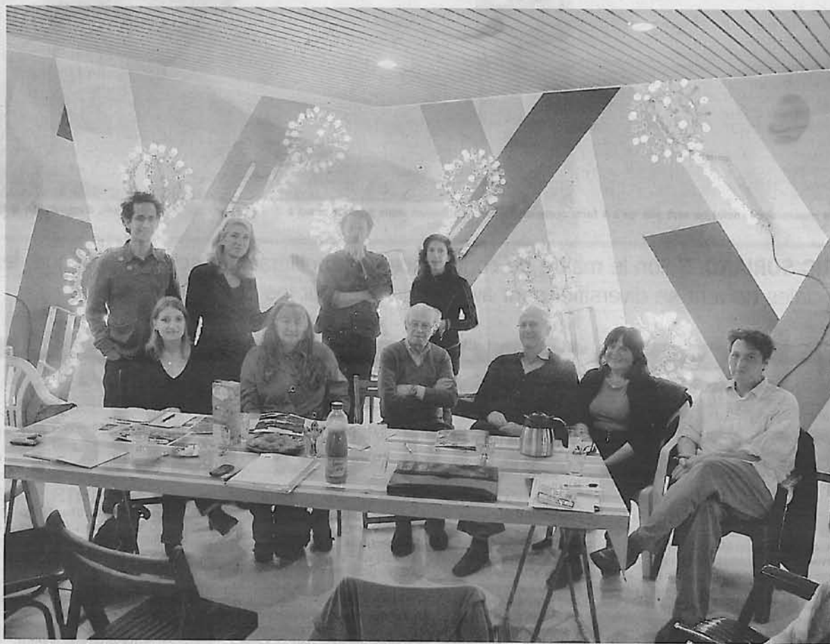
Quand des artistes farfelus se liguent avec des habitants rêveurs, le quotidien s'éclaircit.

Ainsi, à 18 heures, les illuminations sortent des logements et prennent place sur les façades, les toits et les balcons mais aussi les jardins et les maisons. Elles s'exposent aux regards et donnent à