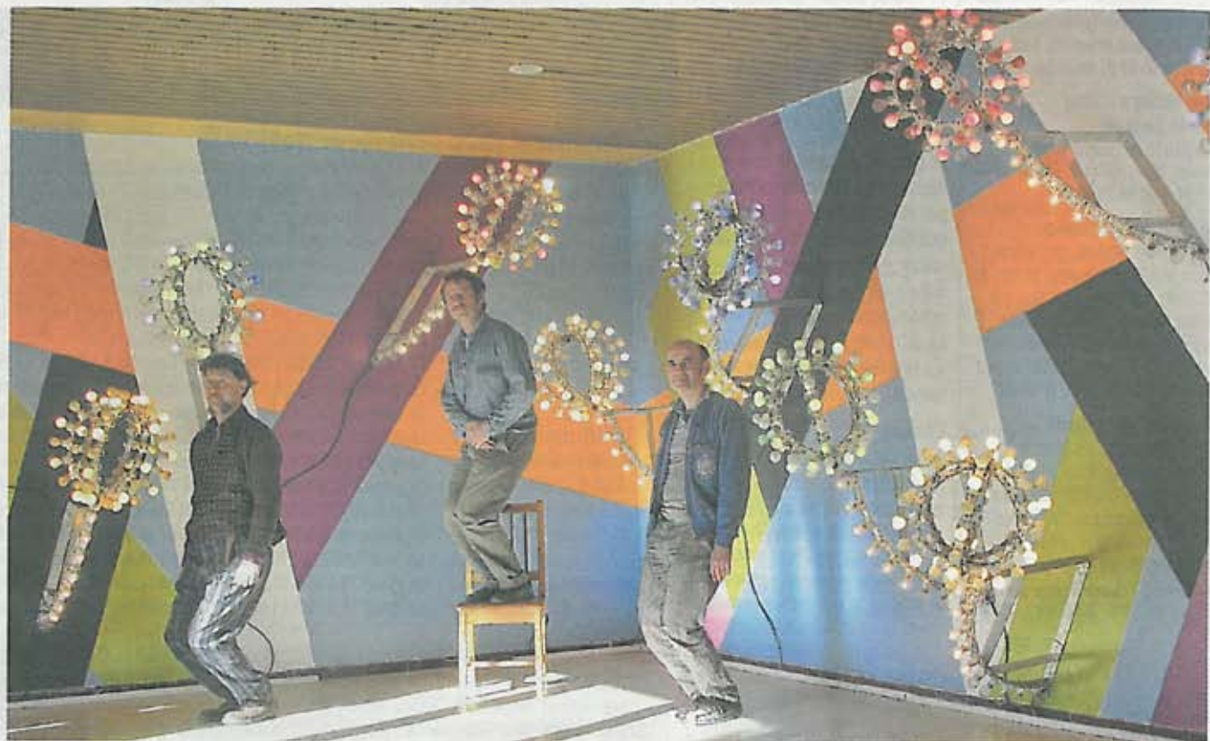
LES PAS PERDUS

Le collectif Les pas perdus a trouvé un nouveau terrain d'expression artistique au sein de la résidence de Fonscolombes dans le 3 e .